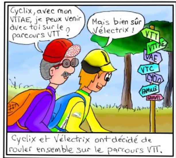
Cyclix et Vélectrix ont décidé de rouler ensemble sur le parcours VTT.