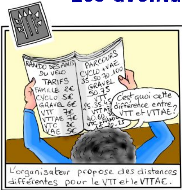
L'organisateur propose des distances différentes pour le VTT et le VTAE.