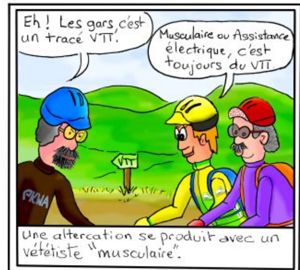
Une altercation se produit avec un vététiste "musculaire".