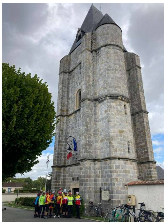
Tour du Pilori de Lormaye

Si pour le circuit 81 km il était temps de mettre les voiles vers Epernon, notre destination du jour, le circuit 117 km s'autorisait un détour vers la charmante cité de Gallardon, autre BPF du week-end.