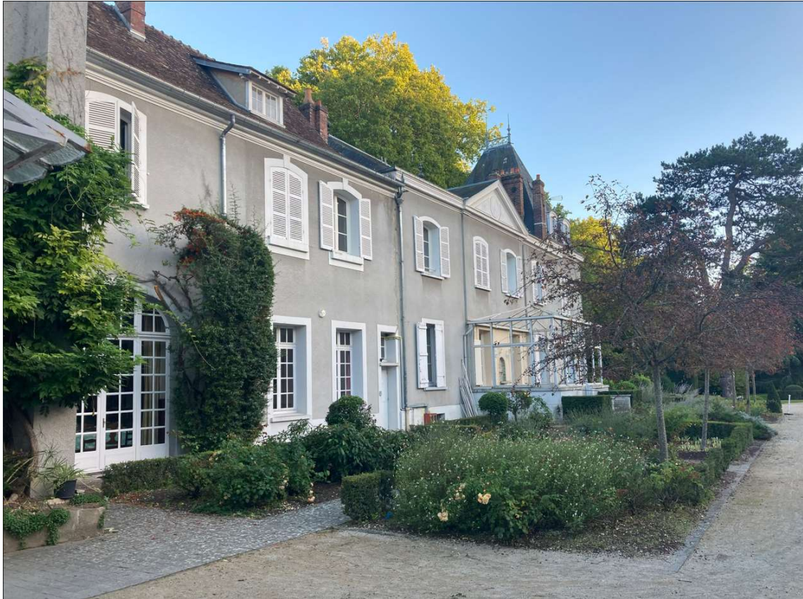
Le prieuré Saint-Thomas d'Épernon

Le lendemain matin nous nous dirigeâmes vers Maintenon, notre troisième site BPF à une dizaine de kilomètres d'Épernon. La visite de son château était au programme. Outre la beauté des lieux, nous avons eu la chance d'être d'accompagnés lors de la visite par une jeune guide passionnée qui aura su nous captiver avec l'histoire de ce château et l'extraordinaire destin de madame de Maintenon.