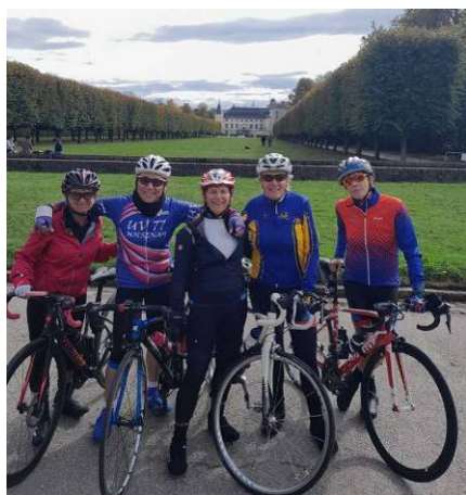
Devant le château de Rambouillet