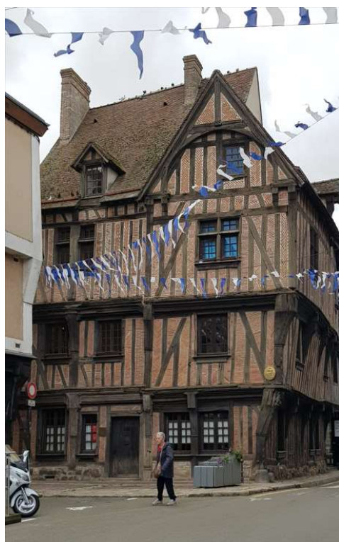
Nogent et ses maisons à colombages

Mais il fallait déjà lever le camp pour commencer à s'orienter vers la vallée de l'Eure et atteindre la belle ville de Nogent-le-Roi avec ses rues bordées de maisons à colombages et découvrir la très belle tour du Pilori de Lormaye, commune mitoyenne de Nogent, tour-clocher d'une ancienne église qui abrite désormais la mairie.