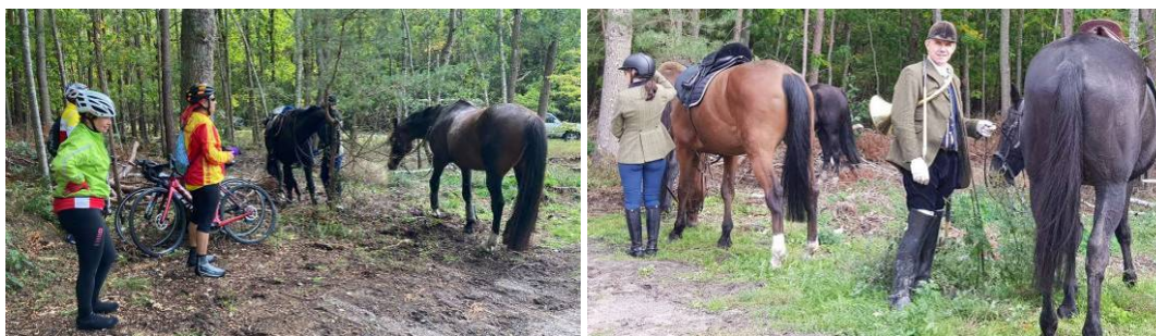
Rencontre inattendue sur le lieu du pique-nique

Mais il fallait déjà lever le camp pour commencer à s'orienter vers la vallée de l'Eure et atteindre la belle ville de Nogent-le-Roi avec ses rues bordées de maisons à colombages et découvrir la très belle tour du Pilori de Lormaye, commune mitoyenne de Nogent, tour-clocher d'une ancienne église qui abrite désormais la mairie.