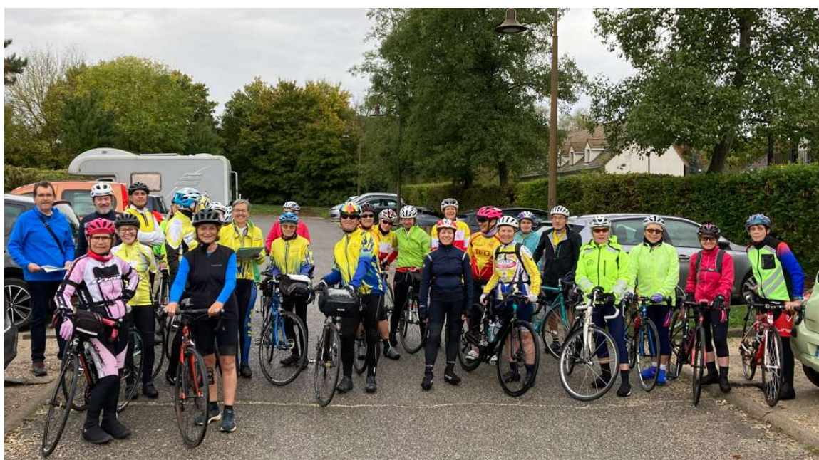
Photo du départ

Rendez-vous avait été donné à 10h ce matin du samedi 1 er octobre à Gif-sur-Yvette pour un week-end organisé par la commission féminine du Codep 91. 24 cyclotes et 8 cyclos, qui avaient eu à choisir entre 3 parcours de 52, 81 et 117 km pour le menu du samedi, s'étaient réunis sur le lieu du départ avec enthousiasme. Grand luxe : 2 camping-cars accompagnateurs étaient de la partie.