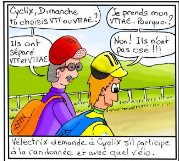
Vélectrix demande à Cyclix s'il participe à la randonnée et avec quel vélo.