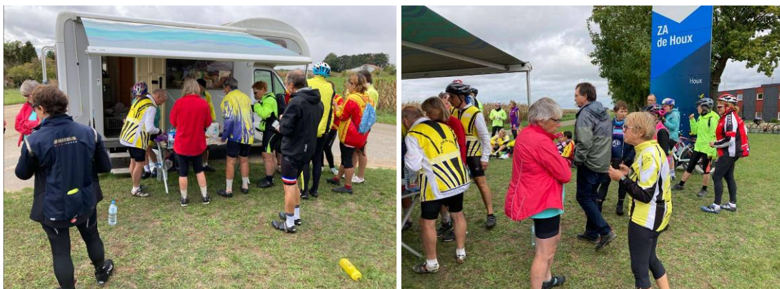
Pique-nique sur le chemin du retour