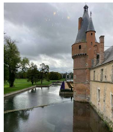
Devant le château de Maintenon avec au loin son aqueduc inachevé

Le circuit du retour vers Gif-sur-Yvette fut commun aux 3 groupes et, après une dizaine de kilomètres parcourus, un bon pique-nique nous était préparé par nos logisticiens. Mais déjà les nuages menaçaient et quelques gouttes de pluie apparaissaient !