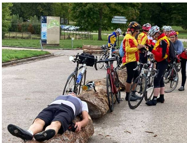
Pause dans le parc du château de Rambouillet

A l'arrivée les éléments s'étaient calmés et les mines enjouées montraient que nous avons partagé un formidable week-end cyclotouriste, les cyclottes et cyclos parlant déjà d'un prochain rendez-vous ! Et cela tombait bien puisque la commission féminine du Codep 91 planche déjà pour un nouveau week-end similaire en 2023.